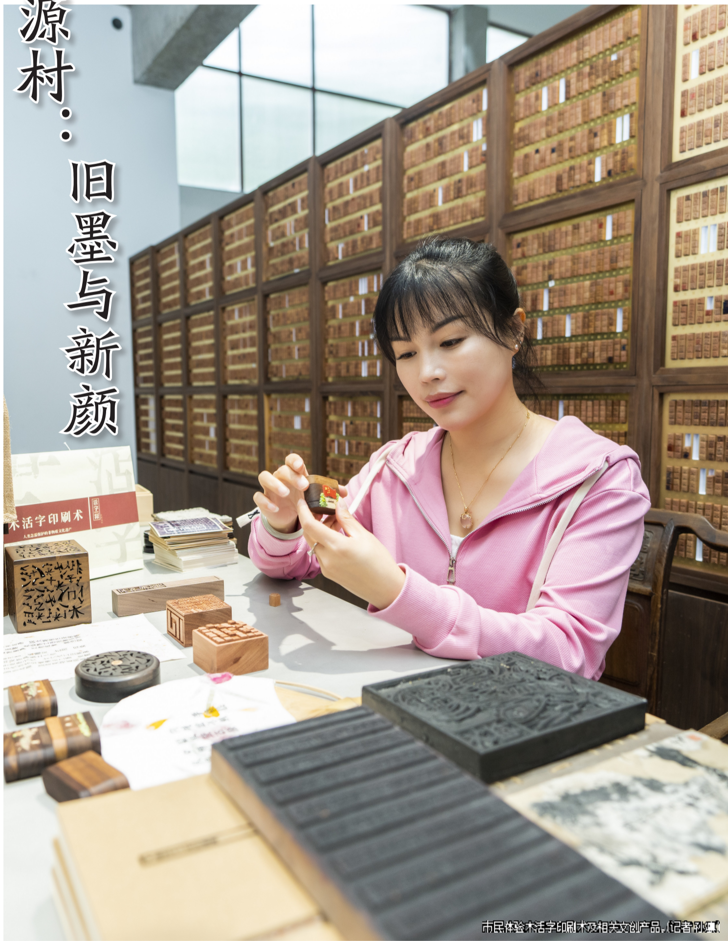
市民体验活字印刷术及相关文创产品。(记者 孙斌)