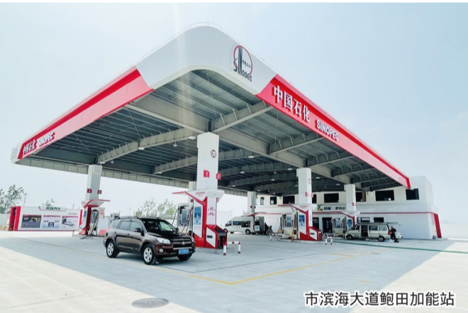
市滨海大道鲍田加能站