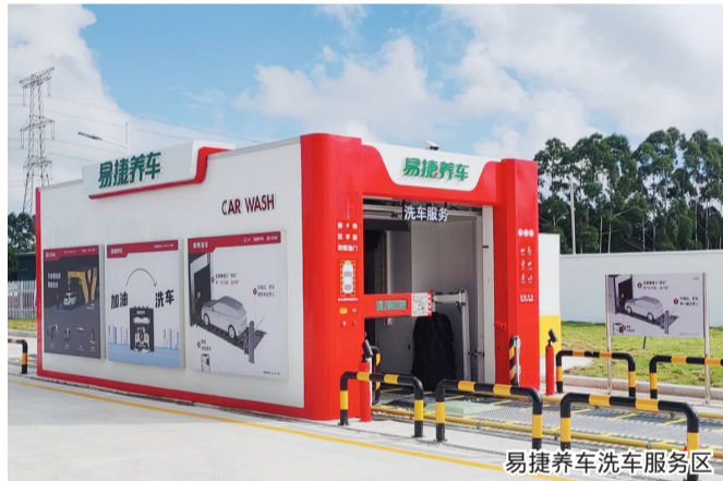
易捷养车洗车服务区

本报讯(记者 陈异俗)8月21日18时许,我市滨海大道鲍田加能站拿到温州市商务局成品油零售许可证,正式对外营业,预计年销售额可超亿元,创收近千万元。