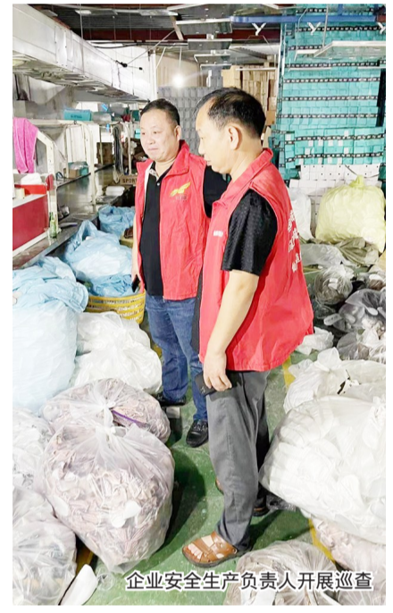
企业安全生产负责人开展巡查

下一步,仙降街道将继续加强与村(社)及企业的合作,并不断完善相关政策和法规,为打造安全稳定的生产环境不断努力,进一步提升街道的安全形象和居民的生活品质。