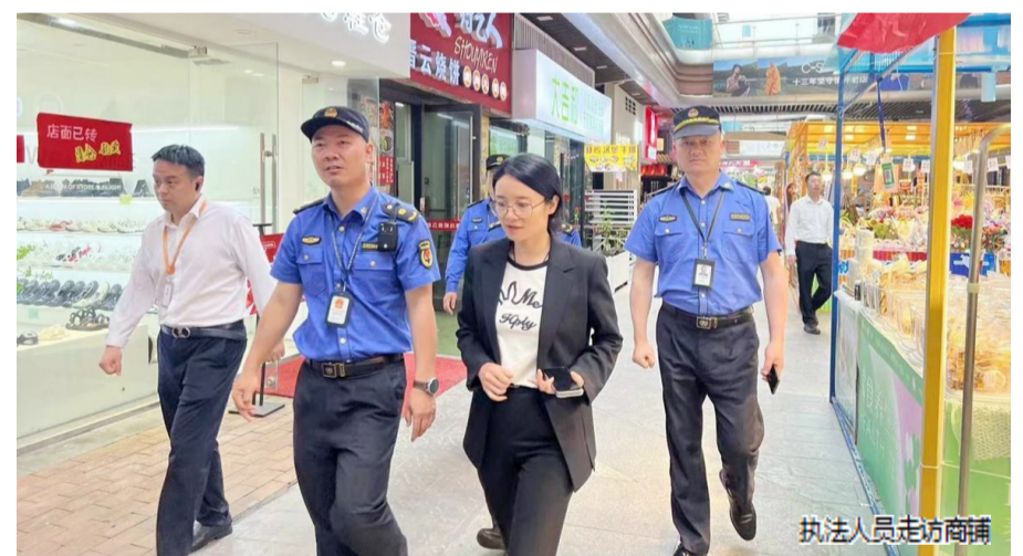
执法人员走访商铺

同时,依托执法帮扶活动做好法律宣传工作,通过入企宣传让企业快速、简明、准确地了解和排查行政处罚风险点,熟悉与企业生产经营活动密切相关的法律法