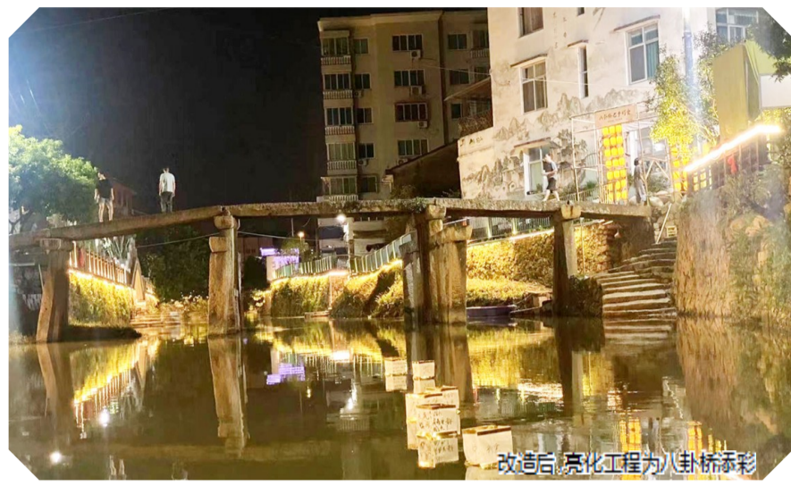
改造后,亮化工程为八卦桥添彩