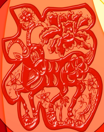
山西运城 李惠芳作