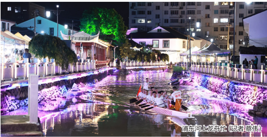
浦东河上龙舟忙 (记者 蔡伟)