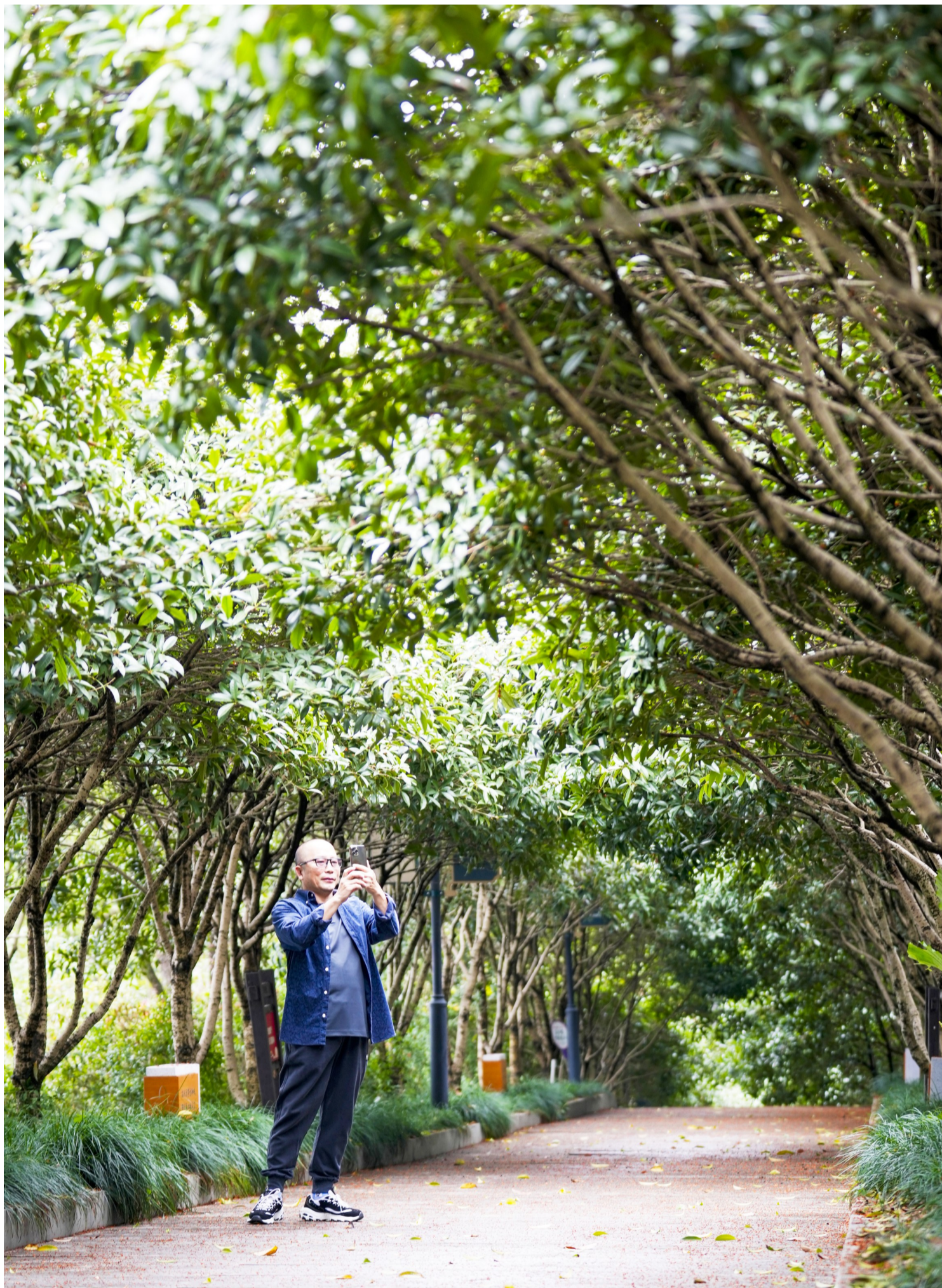
市民在西山桂花长廊驻足赏桂。(记者 孙秉)