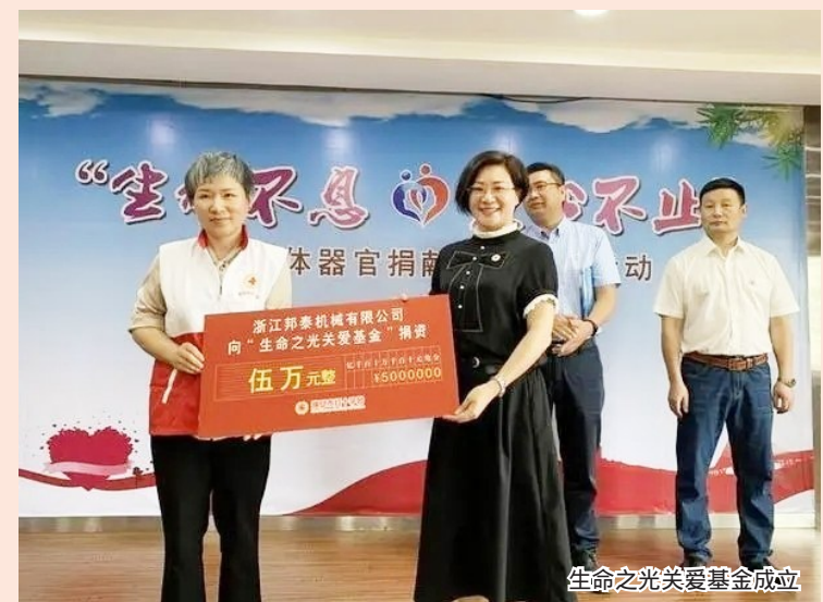
生命之光关爱基金成立