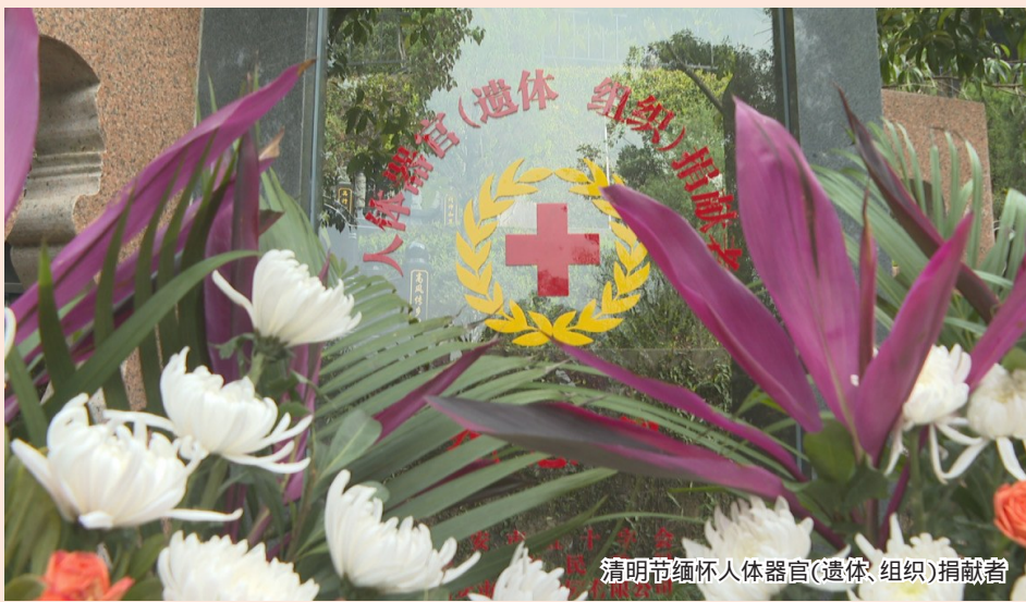
清明缅怀人体器官(遗体、组织)捐献者