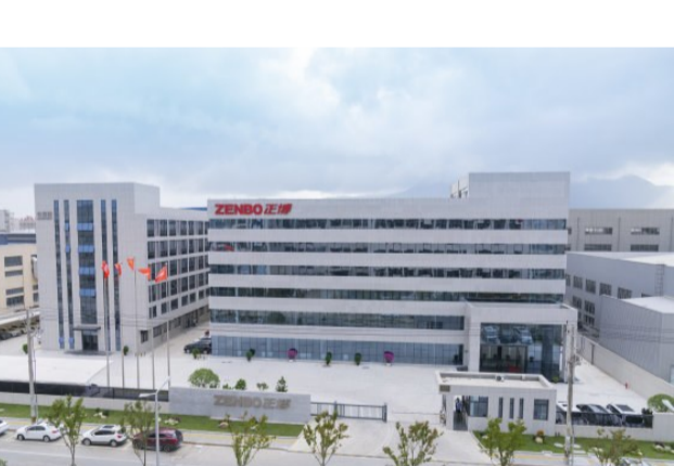
正博智能机械厂区