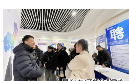
局长(左)了解企业需求

作为此次新春系列招聘会的重头戏,新春大型人才交流会也为后续春季招聘工作开了一个好头。每年春季,是人才招引的窗