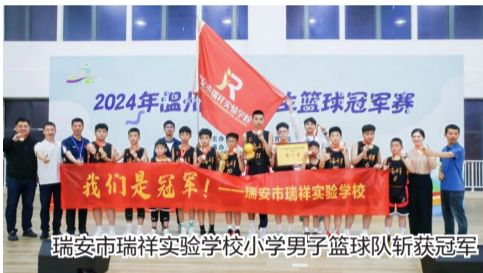
瑞安市瑞祥实验学校小学男子篮球队斩获冠军