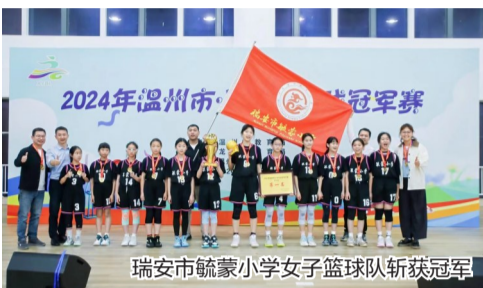
瑞安市毓蒙小学女子篮球队斩获冠军