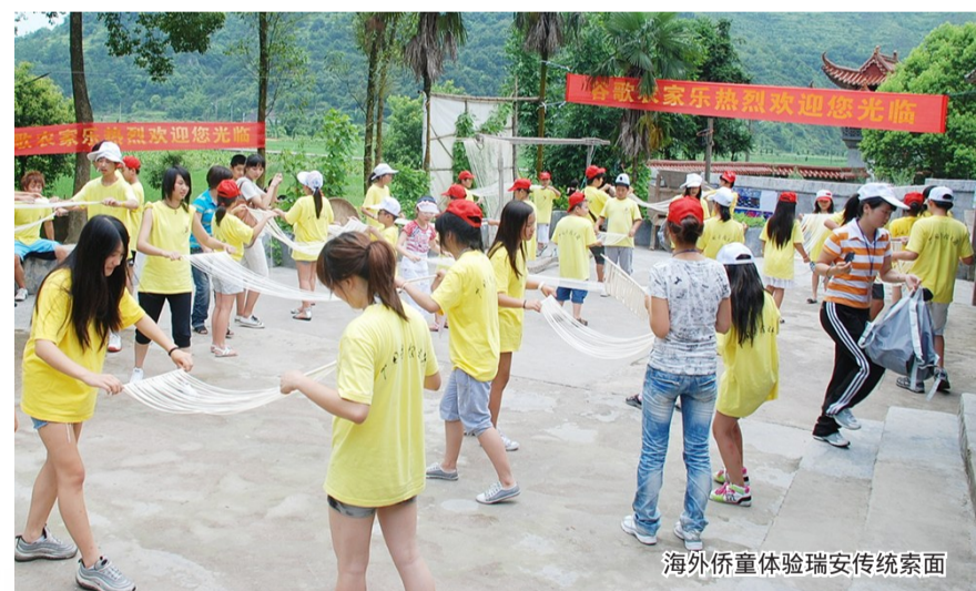
海外侨童体验瑞安传统索面

瑞安市还不断创新华文教育品牌项目，自2006年起，举办海外华裔青少年“中国寻根之旅”夏令营，在他们心中种下了一颗“根在中国”籍在瑞安”的种子；自2022年起，开办周末侨童学堂，开设瑞安地方优秀传统文化课程60多门，为全球180个国家和地区的华裔青少年及海外华校提供线上直播课程。这些活动，自开办起都一