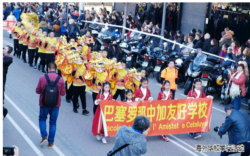
海外华校举行活动