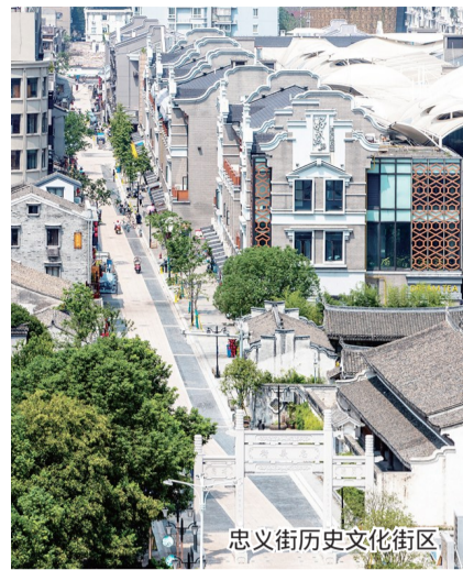
忠义街历史文化街区