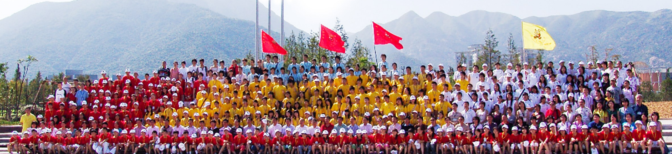
温州寻根之旅瑞安分营合影