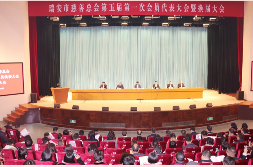
第七届瑞安慈善大会

在第四届理事会期间，市慈善总会以扶危济困、安老助孤、医疗救助等为核心使命，积极开展多元化慈善活动。2018年9月至2024年8月底，累计募集善款4.3亿元，支出善款4.33亿元，救助困难群众20.2万人次，受益群众达70.91万人次，荣获第六届“浙江慈善奖（扶贫攻坚奖）”、第七届“瑞安慈善奖（慈善事业突出贡献奖）”等多个奖项。