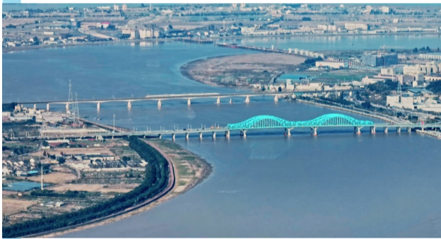
飞云江大桥&姐妹桥

一座城市,因水而有了灵气,因桥梁而有了诗意。短短十余公里的江面上,横亘着飞云江姐妹桥、高速桥、高铁桥等十座大桥。独特的造型,多彩的颜色,如同俯卧在飞云江面的彩虹,在每个清晨或黄昏为城市写下浪漫的诗。