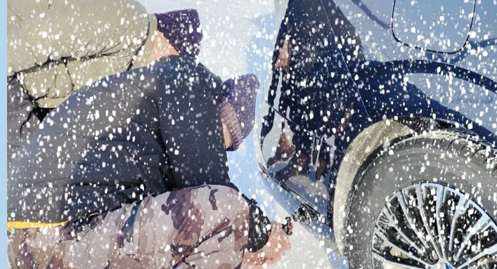
戈尔德公司进行产品极寒试验