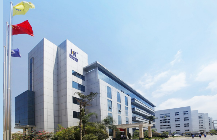
环球滤清器企业外貌