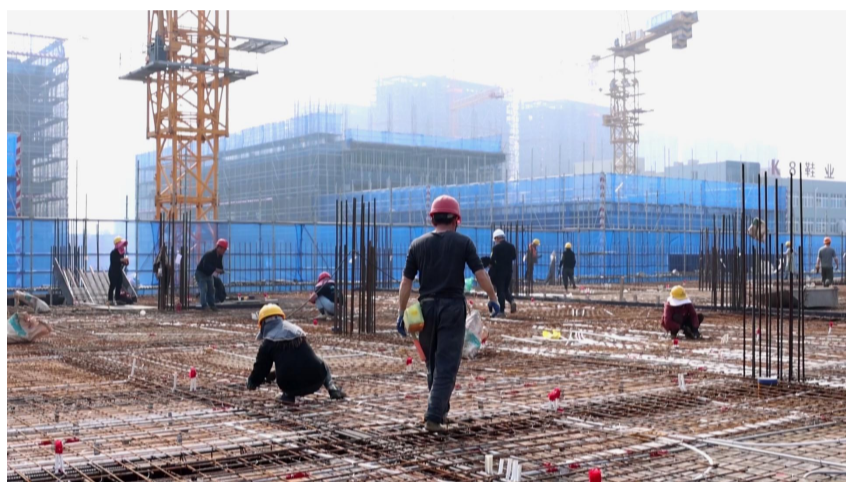
工人们在熟练地捆扎钢筋笼

还是部门间的协调问题,业主方均全程介入,一线化解,确保施工无阻。特别是针对渣土消纳这一难题,经过滨海新区工作专班的协调和对接,安排了渣土消纳场,确保工程有序推进。