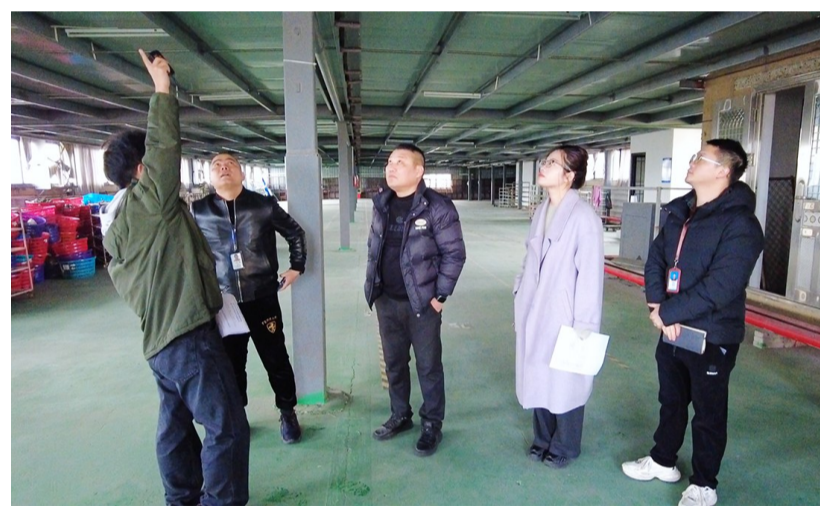
职能部门联合调查,督促企业整改

在现场走访过程中,记者发现大部分企业的光伏板下面存在违规搭建和加高的现象。根据相关规定,在不同时期,瑞安市对于分布式光伏发电项目的光伏板下面的高度有着明确限制:2019年6月18日至2023年9月13日期间,根据《瑞安市分布式光伏