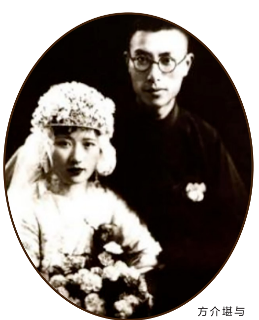
方介堪与王舜瑛结婚照

方介堪一生勤奋，刀耕不辍。据不完全统计，在70年的艺术生涯中，他治印总数超过两万方，现存世5407方。齐白石、张大千、吴昌硕、刘海粟、黄宾虹、马孟容、傅抱石、潘天寿、郭沫若、韩天衡等书画大家的常用印章，多出自其手。2010年，笔者在参与编写《方介堪与中国文化名人》一书时，有幸观摩其存世的部分印章，深感方寸之间点画之妙，尽显金石艺术的智慧与力量。根据《国家文物局关于颁布1911年后已故书画等8类作品限制出境名家名单的通知》，方介堪被列入玺印类作品限制出境名家名单。