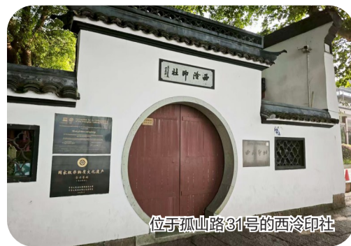
位于孤山路31号的西泠印社