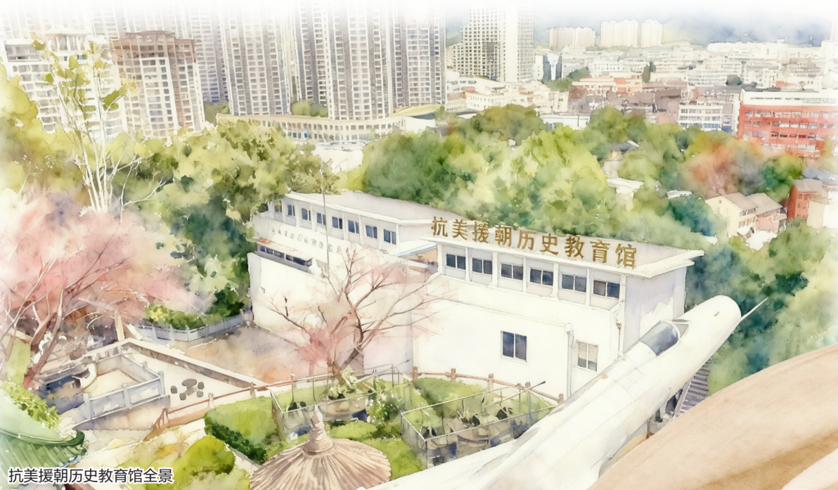
抗美援朝历史教育馆全景