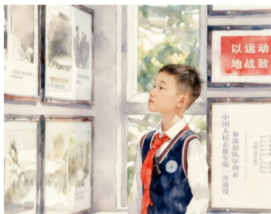
学生参观抗美援朝历史教育馆