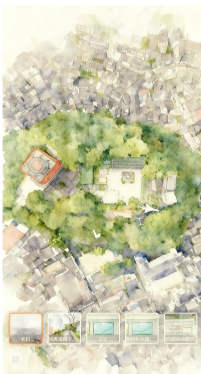
抗美援朝历史教育馆电子场馆截图

在场景呈现上,电子场馆不仅包含“抗美援朝历史教育馆门口”“展厅全景”等场馆实景,还通过“战士在坑道里准备对敌射击”“志愿军从朝鲜撤军回国”等场景画面,以及“瑞籍革命英烈”专题板块,让历史细节更具象、更触动人心。