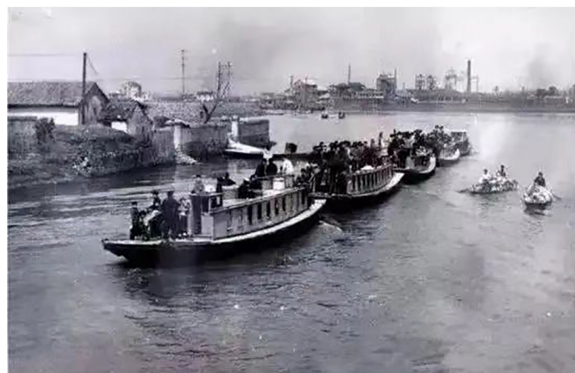
1915年，项湘藻公司小火轮拖着客船行驶在温瑞塘河上