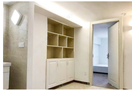
四室两厅两卫的格局，精致装修，采光优良。此房还有车位，报价62万元。