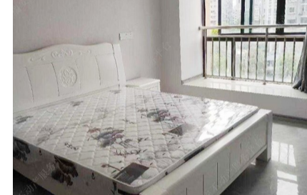
本套房源位于城市家园6楼，建筑面积100平方米，二室二厅一厨一卫，朝南，采光优良，家电齐全，年租金2.8万元。