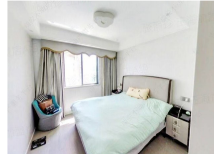
本套房源位于瑞宸苑5楼，建筑面积100平方米，两室两厅一卫，豪华装修，施