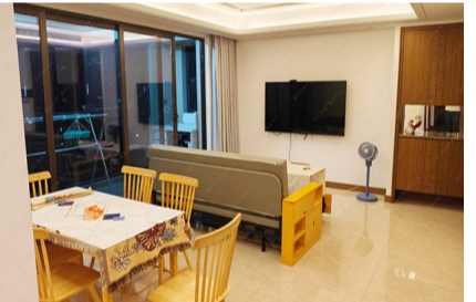
本套房源位于荣安府，新房，建筑面积102平方米，室内家电齐全，可拎包入住。此房还提供一个带充电桩的地下停车位，年租金为3.5万元。