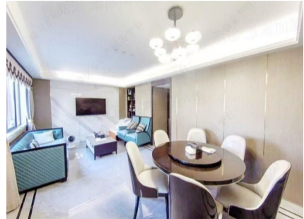
教区学校为瑞安市阳光小学和瑞祥实验学校(初中部)，送车位，报价188万元。