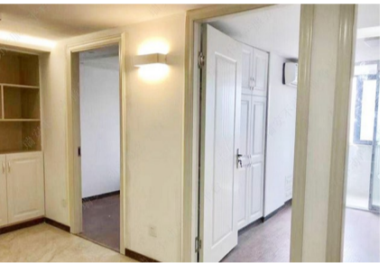
本套房源位于五洲国际商贸城14栋19楼，建筑面积81平方米，装修时分割为两层，故实用面积可达160平方米，