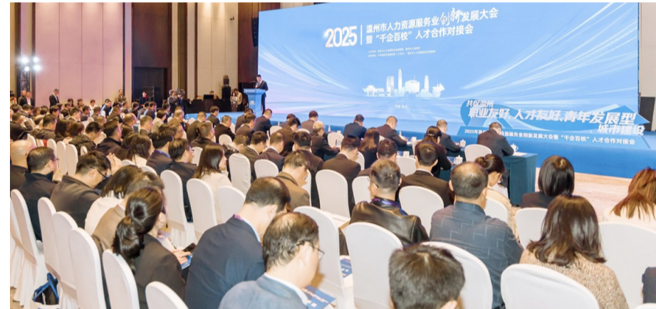
“千企百校”人才合作对接会现场

通过系列改革创新举措，产业园提能升级成效显著。下一步，我市将持续深化省级人力资源服务产业园改革创新，进一步优化硬件设施、完善软件体系、放大亮点效应，推动产业园在提能升级中实现更高质量发展。