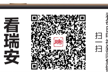
看瑞安 每日电视新闻集锦