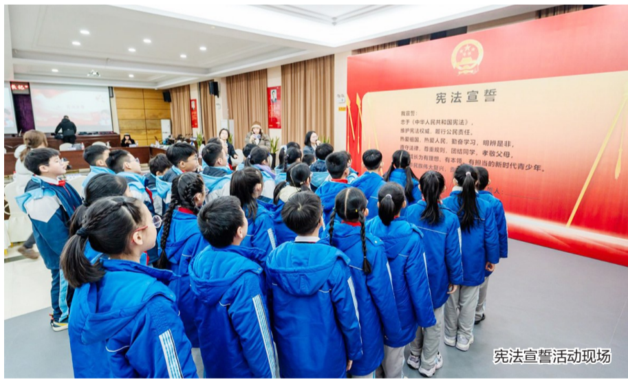
宪法宣誓活动现场