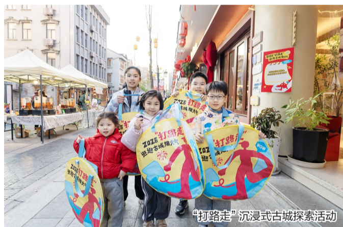
“打路走”沉浸式古城探索活动

元旦假期,忠义街历史文化街区同样活力迸发,非遗体验与古城探索等活动为游客奉上一场兼具文化底蕴与互动乐趣的假日盛宴。