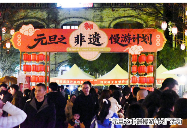
“元旦之非遗慢游计划”活动