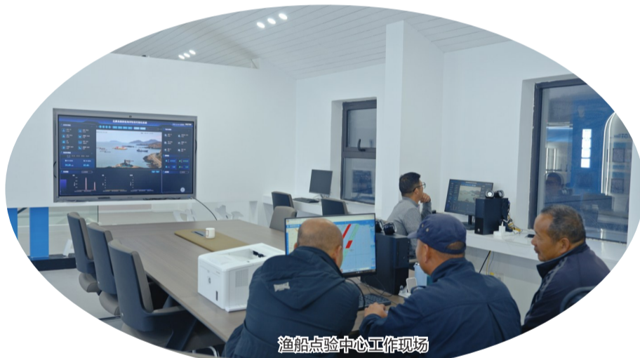
渔船点验中心工作现场