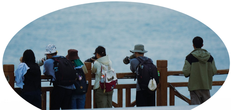
全国观鸟爱好者汇聚北麂拍鸟