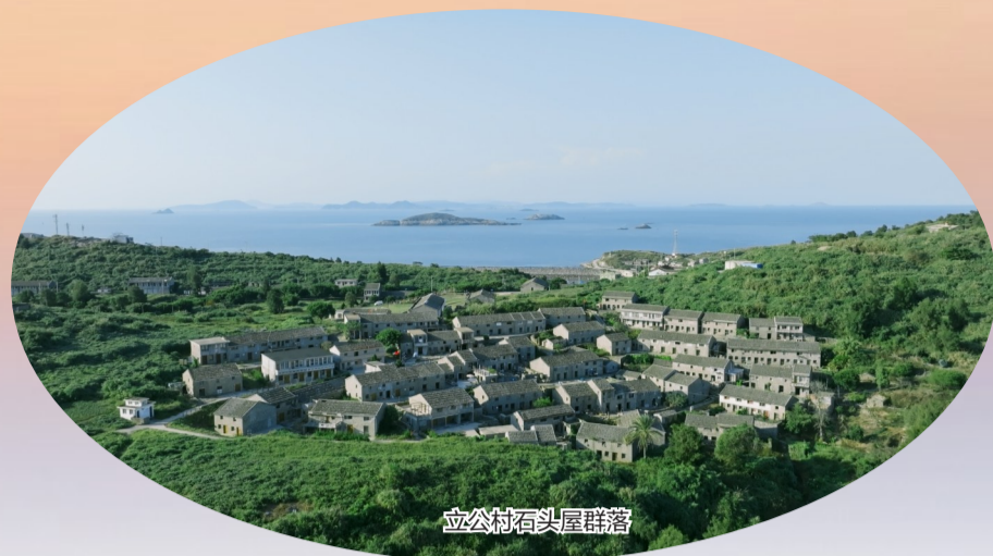
立公村石头屋群落