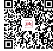
扫一扫,看申领攻略

“消费券发放不仅直接降低消费者购物成本,也有效刺激汽车市场,拉动消费,推动重点消费领域升级换代。”市商务局相关负责人说,此次汽车消费补贴政策的推出,不仅是对中央扩内需、促消费决策部署的积极响应,更是立足本地实际,以精准施策激活市场活力、提升市民获得感的具体行动。目前,消费券发放政策仍在持续实施中,预计春节前我市将迎来一轮新车交付高峰。