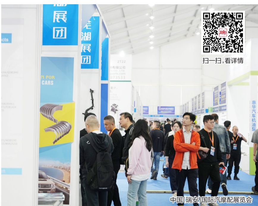
中国(瑞安)国际汽配展览会

这起入选最高法案例库的典型案件,源自10家瑞安鞋企与世界500强企业彪马公司的涉外商标侵权纠纷。当时,彪马公司因商标权益受损诉至瑞安市人民法院,之后案件移送市贸促会先行调解。