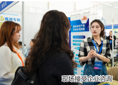
现场接受企业咨询