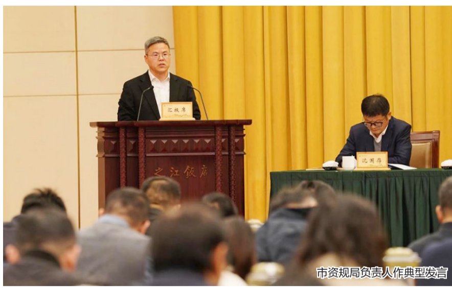
市资规局负责人作典型发言

坚持改革创新,全力释放生态红利,让绿色产业更“生金”。市资规局相关负责人表示,瑞安成功推动全省首个CCER(国家核证自愿减排量)造林碳汇项目在国家平台公示,涉及造林3.78万亩,预计产生碳汇价值超6000万元,树立了全省标杆;“生态司法+碳汇”交易等创新机制落地