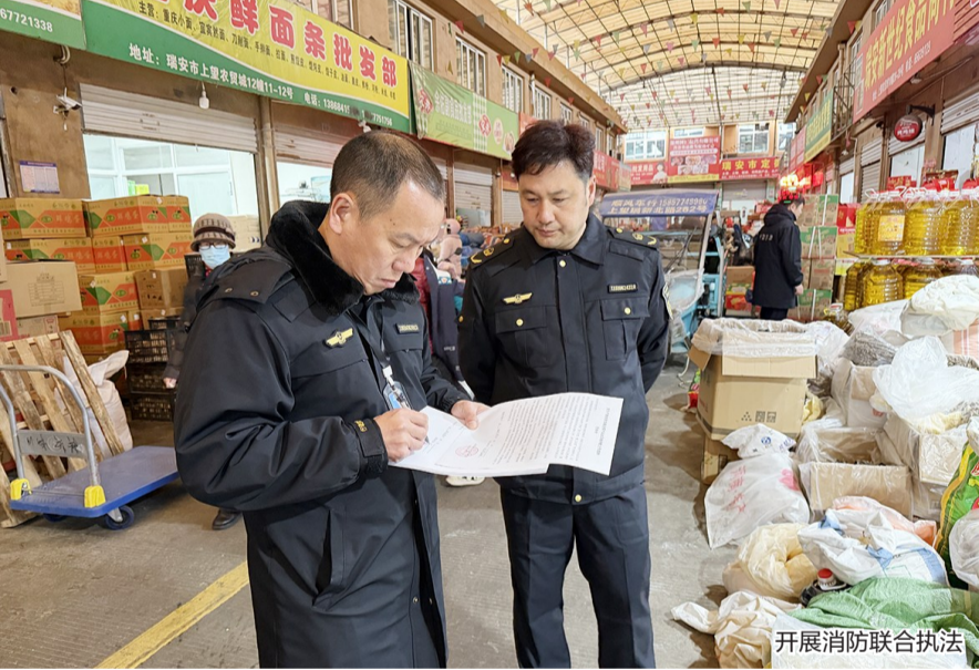
开展消防联合执法

执法队伍采取“定点核查+动态巡查”“现场整改+限期督办”相结合的方式,对农贸市场交易区、仓储区、配电房、消防通道等关键区域开展拉网式排查。重点核查灭火器、消防栓、应急照明、疏散指示标志等消防设施是否完好有效,电气线路是否规范敷设、有无私拉乱接现象,是否存在违规堆放易燃杂物、“飞线充电”、占用堵塞消防通道等问题。此次行动累计排查出消防安全隐患110处,其中现场立即整改31处,对11家存在灭火器过期、电气线路裸露、消防通道堆放货物等无法及时整改问题的经营户,现场约谈负责人,下达《消防安全隐患整改通知书》,明确整改时限,建