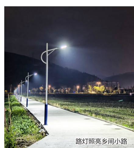
路灯照亮乡间小路

都社区的灯光连点成片。据悉，此次亮化工程是对江都社区基础设施的升级，更是潘岱街道对“民有所呼、我有所应”的生动诠释。该街道相关负责人表示，将持续排查完善基础设施，用心解决居民“急难愁盼”，以治理温度提升居民幸福感、获得感。