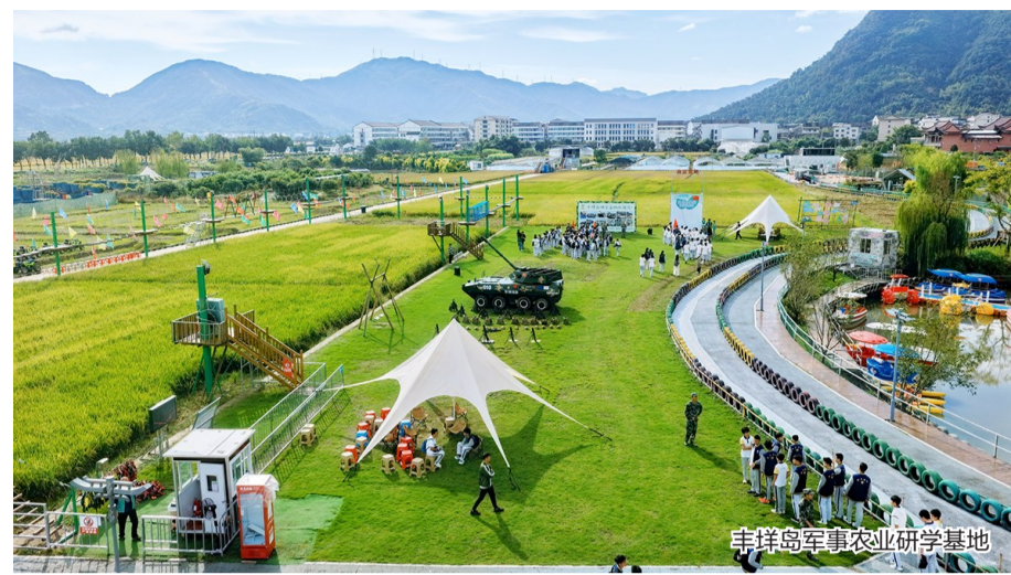
丰洋岛军事农业研学基地

本报讯(记者 徐心星)2月1日，一场别开生面的融媒生态圈共建座谈会在马屿镇协山村举行，摄影博主、媒体人、乡村设计师及项目负责人齐聚一堂，通过座谈交流与实地考察，共同为协山村的未来发展献智聚力。