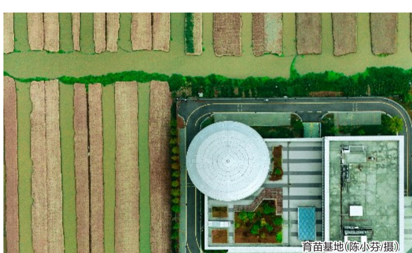
育苗基地

在滨海花椰菜产业农合联的协调下，农户们还在种植、农资采购等方面实现“拼单”合作，显著降低了生产成本；依托滨海现代农业科技服务中心，