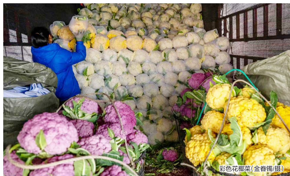
彩色花椰菜