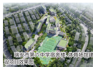
瑞安市第六中学宿舍楼、体育馆建设项目效果图

在基础教育领域，马屿镇成绩斐然。瑞安市第六中学宿舍楼、体育馆建设项目开工建设，总投资6800万元，作为温州市唯一超长期特别国债支持的中学提升项目，将显著改善办学条件；基础教学质量再攀新高，以优异的育人成果诠释了“科教重镇”的内涵。