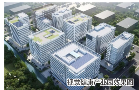
视觉健康产业园效果图