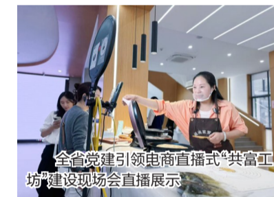
全省党建引领电商直播式“共富工坊”建设现场会直播展示