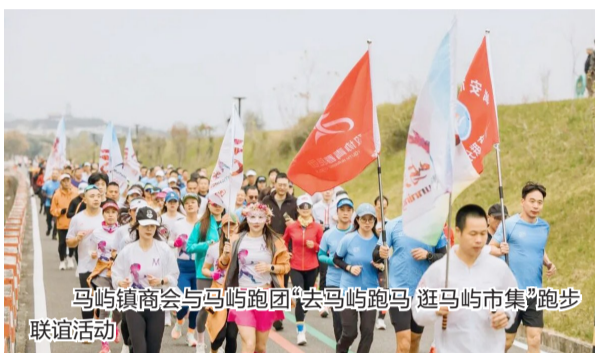
马屿镇商会与马屿跑团“去马屿跑马 逛马屿市集”跑步联谊活动

在“四园合一”的发展蓝图中，家园是民生福祉的落脚点，更是高质量发展的根基所在。长期以来，“住得舒心、过得安心、玩得开心”是马屿镇建设和美家园的核心追求。2025年，这份追求在每一项沉甸甸的荣誉中落地生根。