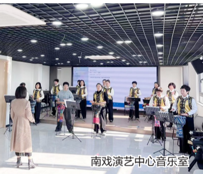
南戏演艺中心音乐室

护”等特色帮扶活动，精准对接低收入家庭、孤寡老人、困境儿童等特殊群体，切实解决群众生活中的实际困难，提升了群众的获得感和幸福感。