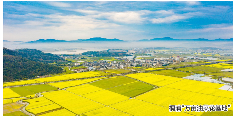
桐浦“万亩油菜花基地”

产业发展的最终目的是惠及百姓，桐浦镇借助粮菌循环省级农业双强项目，打造“粮菌循环六村共富”乡村试点，通过“集体入股+保底分红”模式带动乡村共富，借助秸秆收购帮助周边农户嵌入现代农业发展链条。同时，该镇深化“强村公司”共富机制，通过六村合营的桐顺农业发展公司，完成桐兴生态园农业展销区与“榨油工坊”建设，以“万亩油菜花海”为支点，铺就共富示范的新路径。