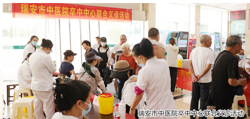
瑞安市中医院卒中中心联合义诊活动

分级诊疗“通”见实效。该院在启用门诊下转系统后，2025年全年门诊和住院累计下转患者3056人；区域影像中心、心电中心等共享平台高效运转，放射诊断中心服务35821人次，让数据多跑路、群众少跑腿。该院在高楼、玉海、仙降分院运行的联合病房，全年收治患者1445人次，同比提升119%，实现了“小病在社区、康复回基层”的诊疗新格局。