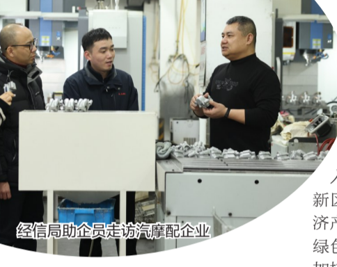
经信局助企走访汽配企业

在产业发展过程中,重大项目成为拉动集群提速扩量的强劲引擎。2025年,计划总投资约10亿元的汽车辅助驾驶零部件及模具研发生产基地项目顺利落地,项目达产后预计年产模具1000套、汽车部件400万套,每亩年产值不低于850万元,将进一步补齐产业链短板,强化核心链条竞争力。与此同时,瑞安集群空间布局与创新生态持续优化,以中国(温州)智车谷为核心牵引,构建起“一核一镇一区一廊”产业空间格局,形成“研发—孵化—产业化”全链条创新体系。