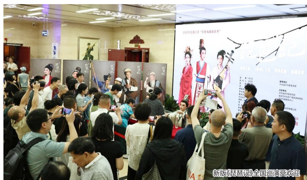
新版《琵琶记》全国巡演受欢迎

2025年,瑞安市越剧团以“体制重塑、机制创新、艺术守正”三维发力,通过专班化运营、精品化创作、市场化开拓,在市场化浪潮中破茧重生,探索出一条国有院团“社会效益与经济效益”双赢之路,让这个老牌剧团真正“活”在当下,交出一份社会效益与经济效益双赢的改革答卷。