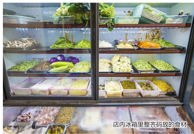
店内冰箱里整齐码放的食材