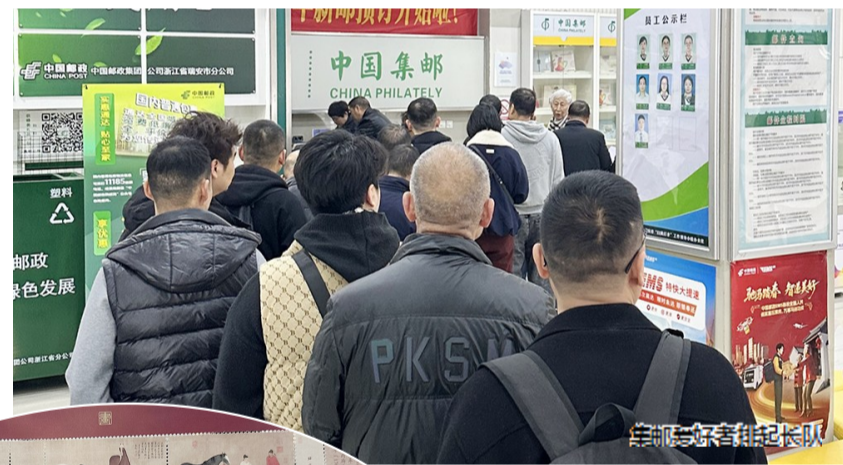
集邮爱好者排队长队

“圉”在古代指养马的地方。《出圉图》是元代绢本设色画,作于至元庚辰(1280年),画面采用平铺式构图,自右向左描绘了圉官和骏马,用笔细腻,形象生动,原作现藏于故宫博物院。《出圉图》特种邮票在版面构成上,采用古画题材常用的连票设计,采用与古画底图尽量接近的淡赭色细边框,衬以红棕色的面值 and 图名,与邮票铭记共同置于版面下方,更好地衬托原画古韵、还原古画原貌。