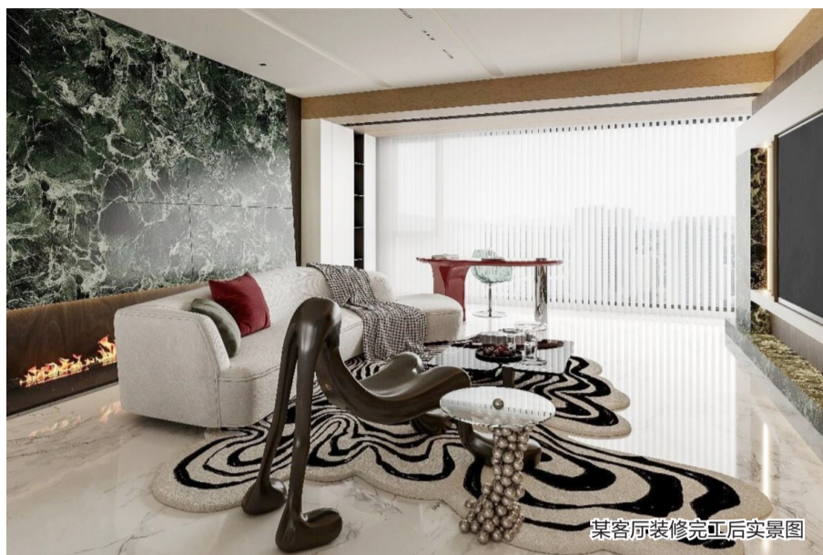
某客厅装修完工后实景图

近日，记者从参与该活动的装修公司了解到，节后各门店装修咨询量、接单量明显攀升。据统计，截至3月13日，150组装修消费券已成功带动近30个家装客户签约，合同总金额突破540万元，马年家装市场跑出了“加速度”。