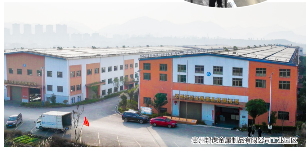
贵州邦虎金属制品有限公司工业园区

生赏识，成为温州至龙港线路的售票员，1000元月薪在上世纪90年代初已是高薪。带着积攒的1万多元回家时，父亲喜出望外，用这笔钱盖起了柴房——这是他第一次尝到“靠自己改变生活”的甜头，但瑞安人“宁为鸡头，不为凤尾”的创业基因，此时也在他心中萌芽，打工不是长久之计，他要自己当老板。