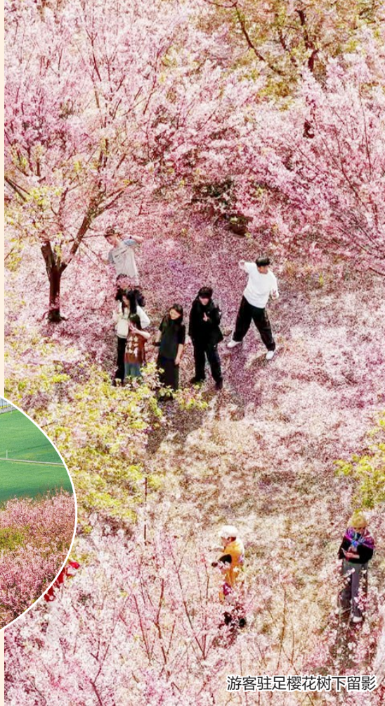
游客驻足樱花树下留影