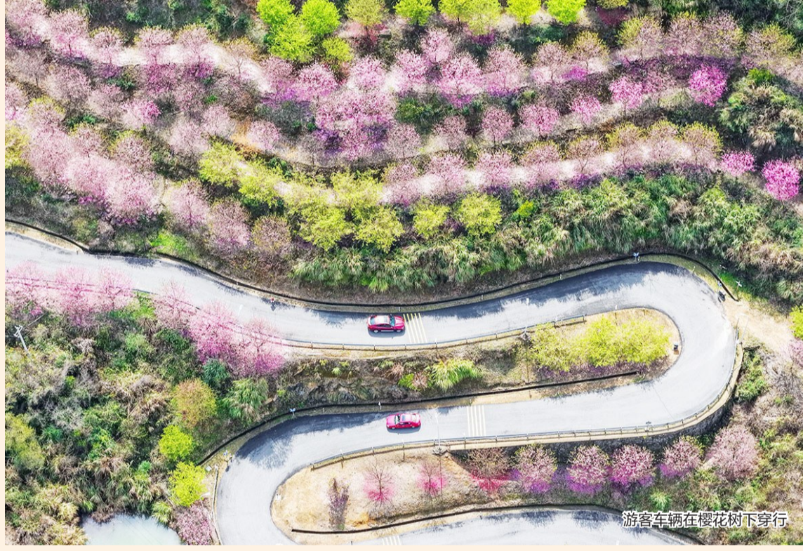
游客车辆在樱花树下穿行