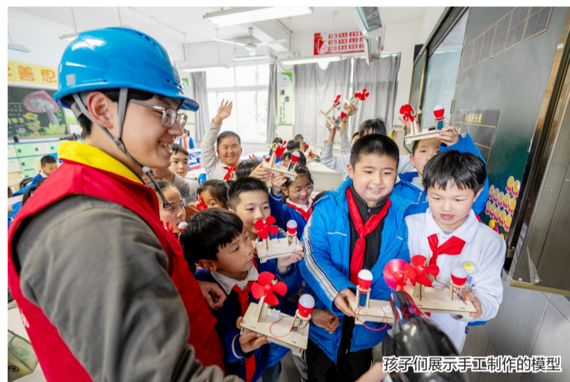
孩子们展示手工制作的模型

型风力发电机模型。在工作人员的指导下,孩子们分组协作,认真拼接叶片、安装电机、连接线路。当看到自己制作的小风扇在风力驱动下转动起来时,孩子们兴奋地欢呼起来。“原来风真的可以发电!”通过动手实践,孩子们不仅理解了清洁能源的原理,更在心中种下了绿色环保的种子。