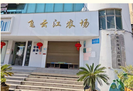
现在位于东山街道瑞光大道1030号的飞云江农场场部