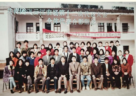
1994年，共青团飞云江农场第十二次代表大会全体代表合影