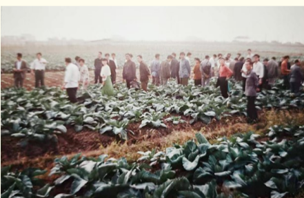
上世纪七十年代，外地农场代表参观飞云江农场蔬菜种植情况