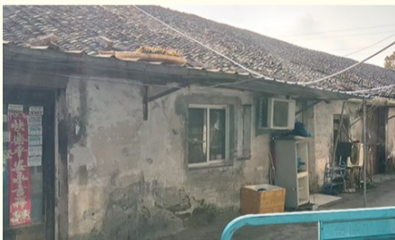
上世纪五十年代末农场职工的住房