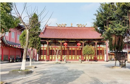
重修后的东山杨府殿。瑞安飞云江农场创立时场部所在地