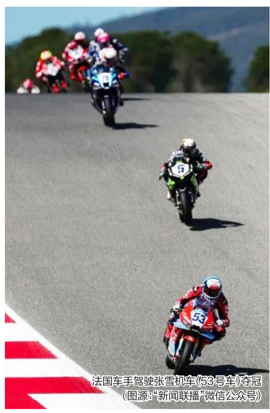
法国车手驾驶张雪机车(53号车)夺冠

2024年,美宝龙车业正式成为张雪机车820rr车型独家配套商,以高精尖零部件实力为冠军战车保驾护航。“两年