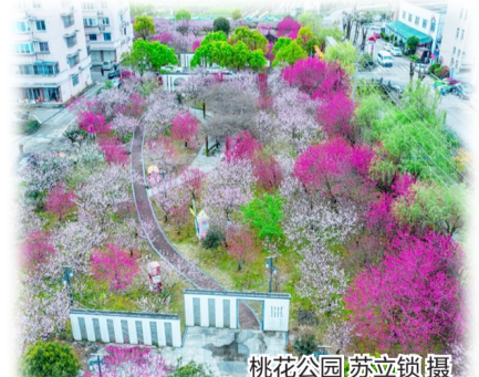
桃花公园

诿让故里，桃源潘岱。尽管昔日的“桃花村”已无踪迹，但如今这儿的“桃花公园”“寺前桃源”等，呈现出更为广阔的桃源盛景。不信的话，不妨到潘岱走一走，看一看？