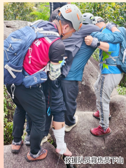
救援人员背伤员下山

外徒步务必把安全放在首位。切勿擅自进入未开发、未开放的野路，出行前应充分评估路线难度和自身条件，尽量结伴而行，不单独行动。行进中不做攀爬陡崖、跳跃溪石等危险动作。如遇意外受伤或迷路情况，及时报警并原地等待专业救援，切勿盲目自救，以免造成二次伤害。