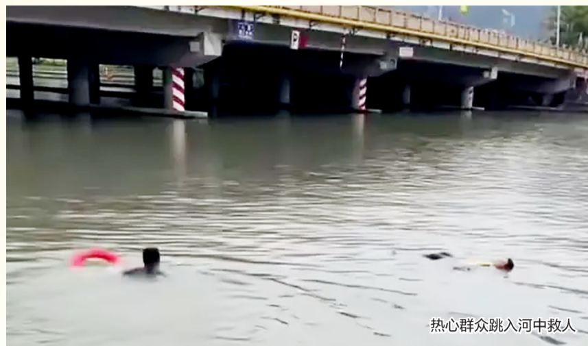
热心群众跳入河中救人

本报讯(记者 金冬冬 陈峰)“有人落水啦，快来救人!”5月9日8时许，塘下镇塘口村河畔传来急促的呼救声。河边迅速聚集了不少闻讯赶来的群众，只见一名男子在河中不断挣扎。危急时刻，一名热心村民套上救生圈纵身跃入河中，奋力向落水男子游去。