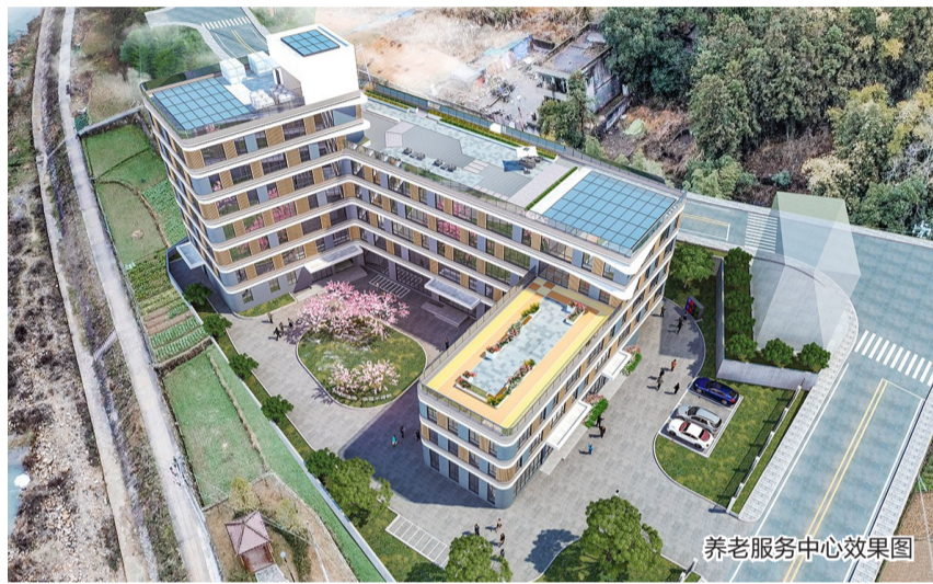
养老服务中心效果图

近日,瑞安市西部养老服务中心项目(下称“养老服务中心”)成功获批2026年养老托育专项中央预算内投资2250万元,这是我市唯一获此专项支持的项目。