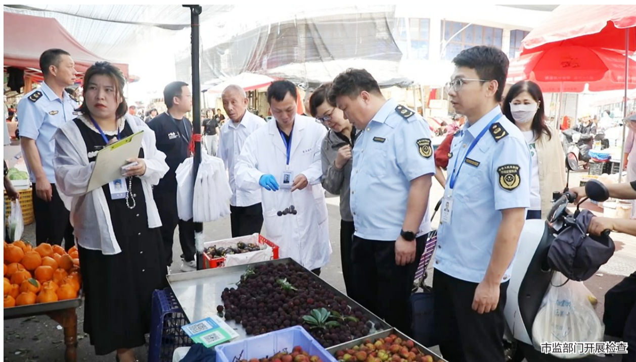
市场监管部门开展检查

监管部门提醒广大市民，目前安阳、塘下辖区在售杨梅安全可控，市民无需过度恐慌。若消费者购买到变质、口感异常等不合格问题杨梅，可保留购物凭证，随时拨打12345热线进行投诉举报。