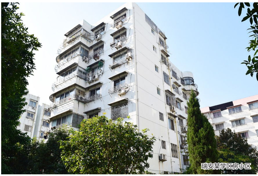
瑞安某学区房小区

过去十几年，“学区房”三个字几乎是瑞安楼市的硬通货。为了让孩子进瑞安市安阳实验中学(本部)、瑞安市安阳实验小学(本部)、瑞安市马鞍山实验小学(本部)、瑞安市隆山实验小学、瑞安市集云实验学校(以下简称“市区五校”)读书,无数家长不惜重金购买学区房,抢得一张孩子入学“入场券”。现在,受最新的国家政策、生源数量以及房地产市场等因素影响,曾经“一房难求”的高溢价学区房,正经历近十年来最深刻的一次调整。